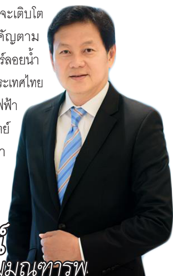
วิธรธน เหมมณฑารพ

พลาสติกในกลุ่มนี้จะเติบโตขึ้นอย่างมีนัยสำคัญตามอุตสาหกรรมโซลาร์ลอยน้ำที่เติบโต เนื่องจากประเทศไทยยังมีโครงการโรงไฟฟ้าพลังงานแสงอาทิตย์บนทุ่นลอยน้ำกว่า 2,700 เมกะวัตต์